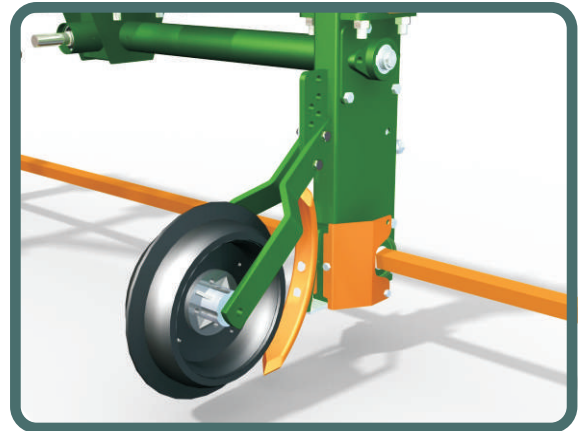
EXCLUSIVO DEFLECTOR PROTECTOR

La barra de acero cuadrado de 32mm, gira a mayor velocidad y en sentido inverso a la marcha del tractor, por debajo del cultivo. Provocando resquebrajamiento d suelo, dejando completamente sueltos a los tubérculos. Logrando detener el crecimiento del cultivo cuando usted desea, obteniendo un tamaño ideal, bajando costos de recolección en un 40% y dejando el tubérculo libre de tierra, sin necesidad de golpearlo.